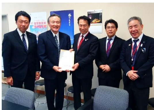
国土交通省 水管理・国土保全局 山田局長