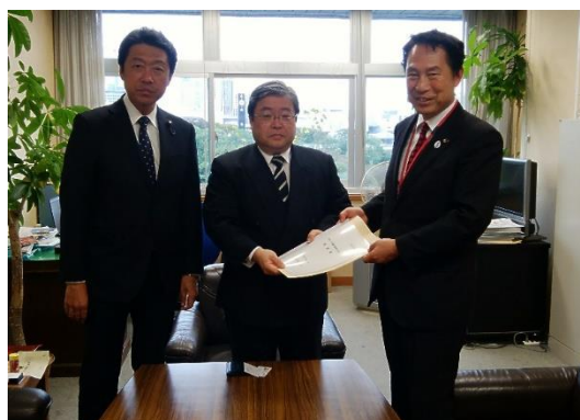
国土交通省 都市局 大内官房審議官